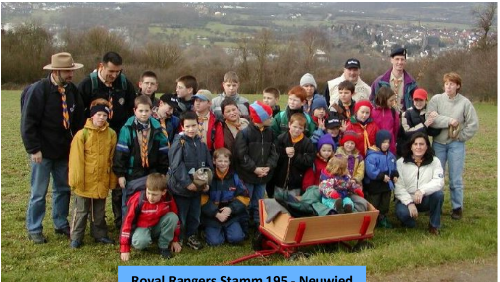
Royal Rangers Stamm 195 - Neuwied

Die Zeit als Pfadfinder bei den „Royal Rangers“ ist vielen in positiver bleibender Erinnerung. Spiel, Spaß und Abenteuer prägten die gemeinsamen Treffen.