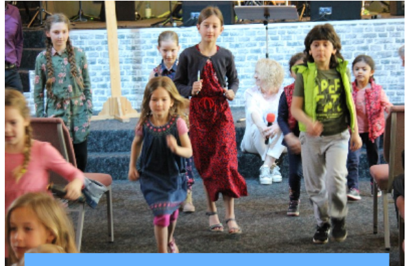
Kinder auf dem Weg zur Kinderstunde

Kinder gehören zum Gemeindeleben. Sie sollen die Liebe Gottes früh erleben. Altersgerechte Kinderstunden, die parallel zu den Gottesdiensten stattfinden, öffnen den Kindern den Zugang zu Themen der Bibel. In diesen Zeiten werden Grundlagen des Glaubens vermittelt, die häufig dazu führen, dass sie sich als jugendliche oder als junge Erwachsene für ein Leben mit Jesus entscheiden und taufen lassen.